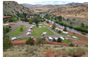
カニータリゾートRVパーク